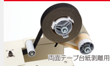
両面テープ台紙剥離用