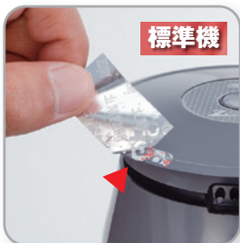
ターンテーブルに転着