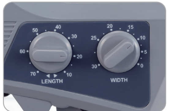
*表記の数字は目安です。